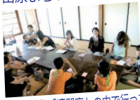
歴史ある建物「清閑亭」の中で行つた 自然体験イベントへの協力