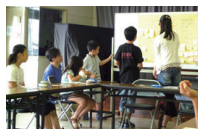
子どものまちのイベントの盛り上げ、運営