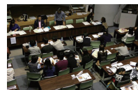
中高生のバンド、ダンスの祭典の PR、 当日の運営、司会等

◆発表会への参加申込み◆ 事前申し込みはとくに必要ありませんが、当日資料に限りがありますので、申し込みをしていただくと確実に資料がお渡しできます。申し込みは 下記に記入の上 FAXしていただくか、必要事項を書いてメールでお願いします。