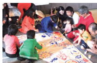
アートイベントの中で、子どもたちが 参加する「元気旗」づくりのお手伝い