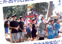
廃校になった学校の宿泊体験施設にきた 福島の子もたちとの交流。お祭りの盛り上げ

子どもたちは 様々な人たちと一緒に、地域のために役割を持って活動することでさらに成長します。