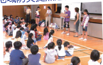
防災訓練の中子ども向け 防災ワークショップの企画と実施他