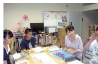
主に障がい者の製品を扱うネット ショップの商品企画への参加等