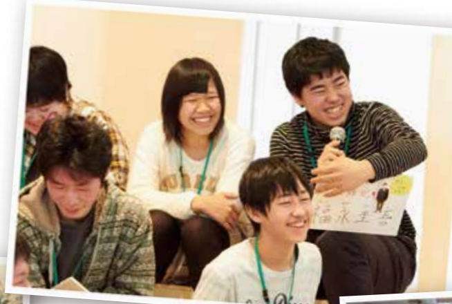
会場の パネル展示