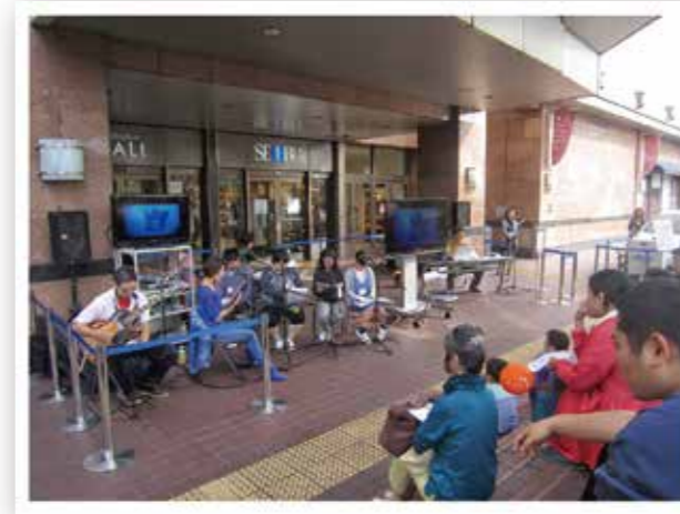
シナリオづくりと ナレーション出演で 水育イベントに新たな取り組み