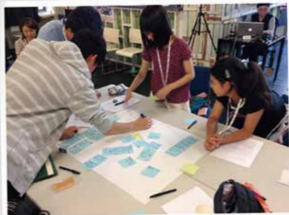
企画ワークショップ