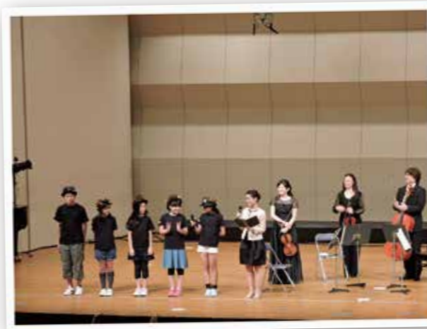
かなフィルのコンサートの 企画をお手伝い