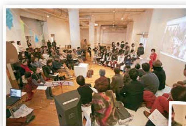
満席になった 成果発表会

受け入れたまちづくり団体の大人と、特命子ども地域アクターが本音でトークする成果発表会です。中高生たちを巻き込むとなにが起ころのか？ボランティア活動の枠を超え、企画からかかわった成果は？