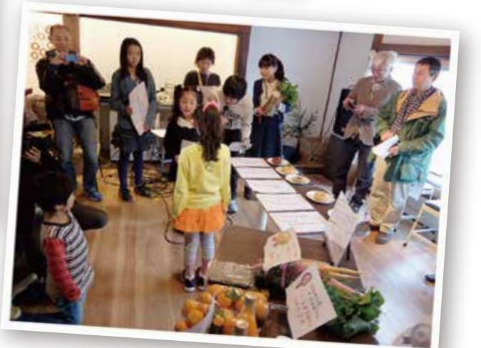
三浦の食材を使った ドーナツコンテスト 司会進行もアクターが！！