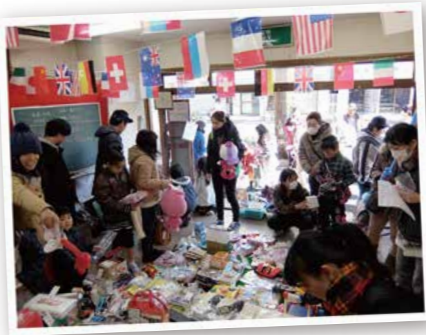
何年もイベントができなかった 商店街で経費ゼロの ポップン鋼管イベント運営