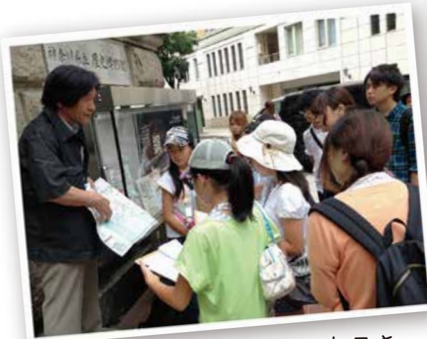
大学生にまじってまちあるき