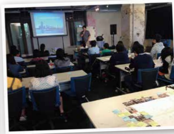
都市デザインの実例を学ぶ