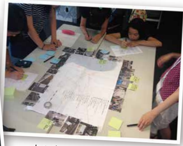
まちあるきをふりかえる ワークショップ